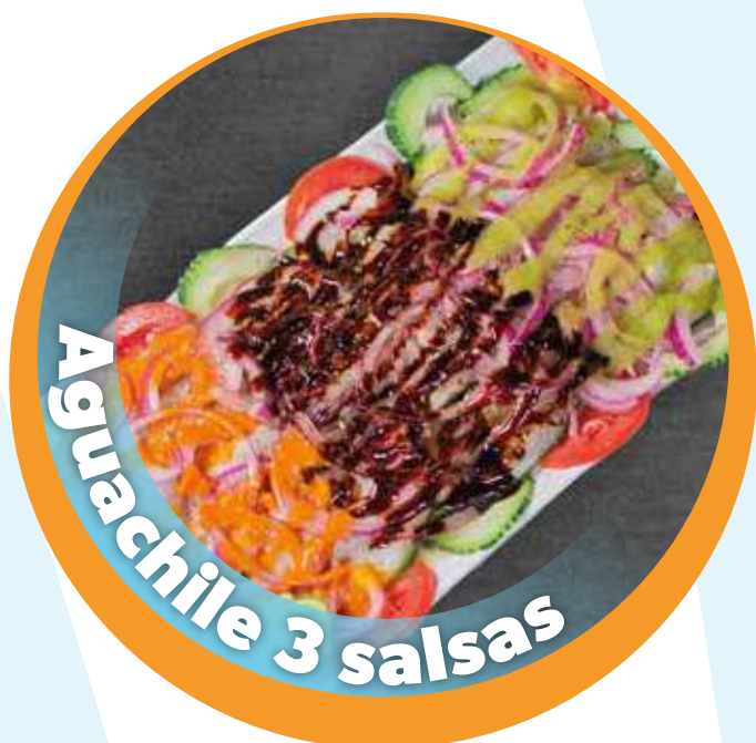
Aguachile 3 salsas