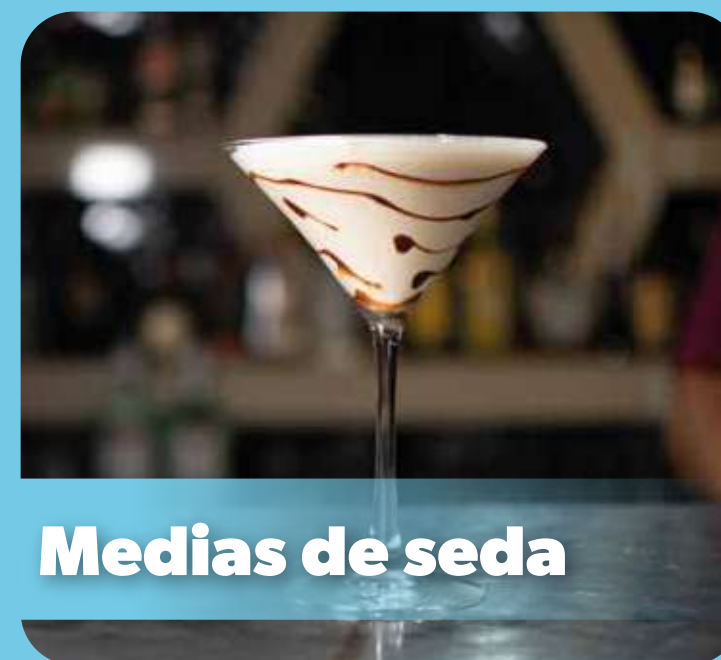
Medias de seda