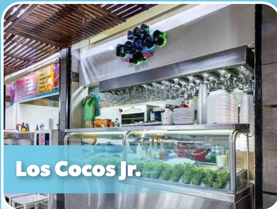
Los Cocos Jr.

Av Cuauhtémoc 17, Maravillas, 57410 Cdad. Nezahualcóyotl, Méx..