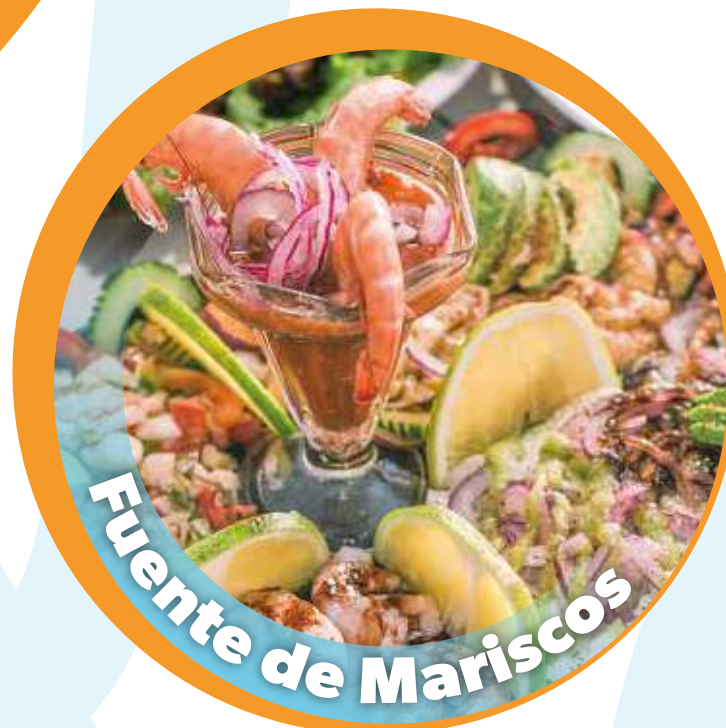
Fuente de Mariscos