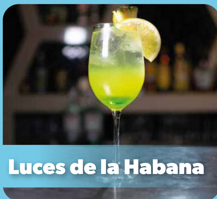
Luces de la Habana